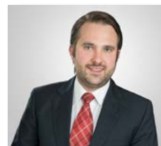
Jacob Krakow Mediaberatung TASPO GARTEN-DESIGN

Tel. +49 531 38004-32 Fax +49 531 38004-43